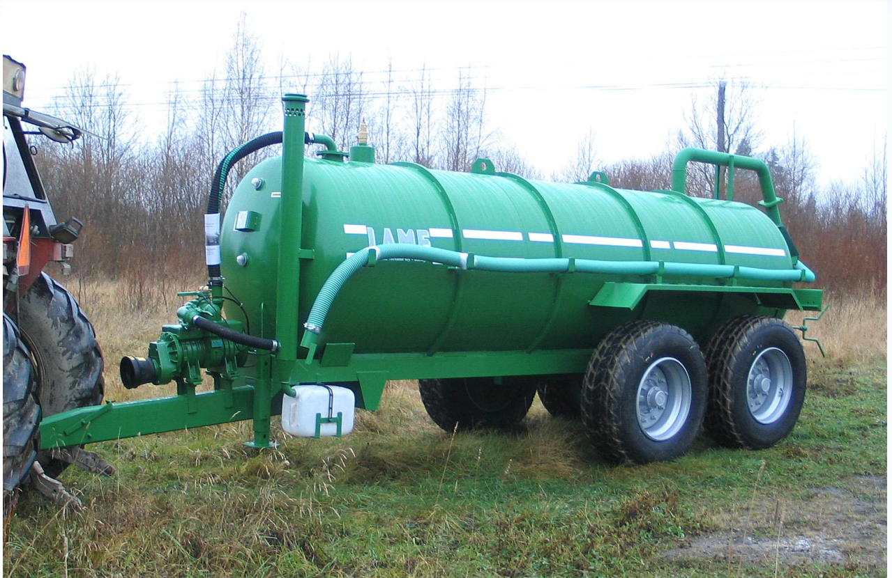
Tilavuus 6800 l Keinuteli 385/65R22.5 renkailla Tyhjiöpumppu 8000 l/min Äänenvaimenin ja öljynkerääjä John Deeren vihreä