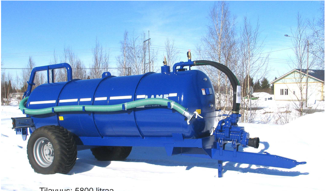
Tilavuus: 5800 litraa Yksiakselinen 550/45 - 22.5 renkailla Tyhjiöpumppu 8000 l/min