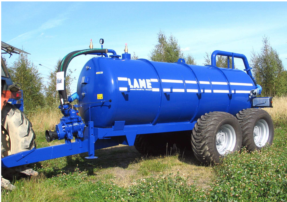
Tilavuus: 5800 litraa Keinuteli 550/45 - 22.5 renkailla Vakiovarustein