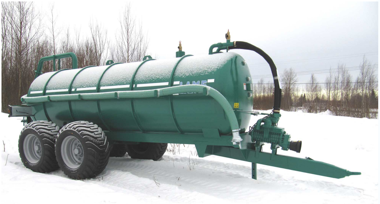
Tilavuus: 7900 l Keinuteli 550/45-22.5 renkailla Tyhjiöpumppu: 8000 l/min